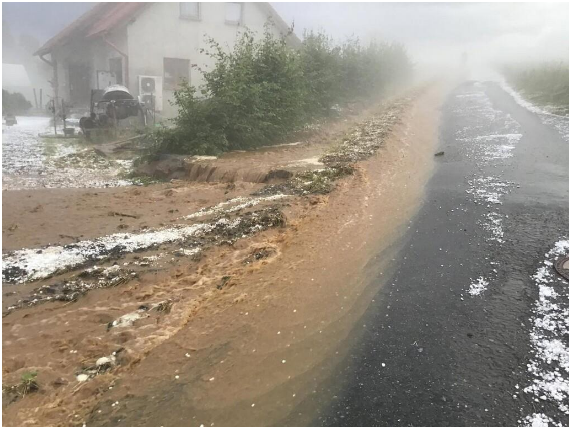
Valící se voda z jižního svahu po místní komunikaci kolem domu čp. 168