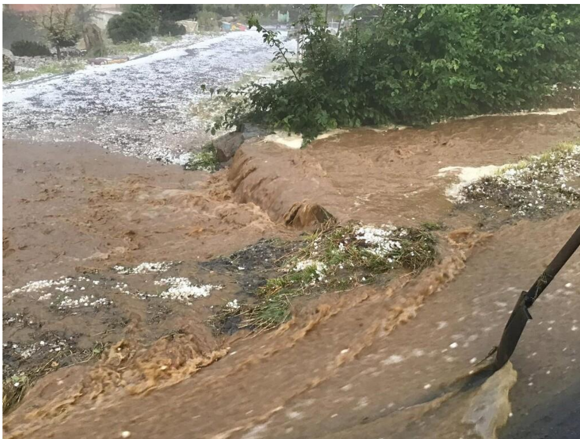
Přijezd k domu čp. 168 a tekoucí voda přes tento příjezd