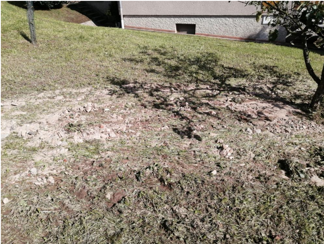
Nánosy kamení a bláta u domu čp. 142, které steklo z jižního svahu nad tímto domem a nad čp. 9