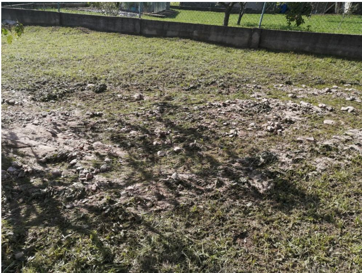
Další fotografie ze zahrady domu čp. 142