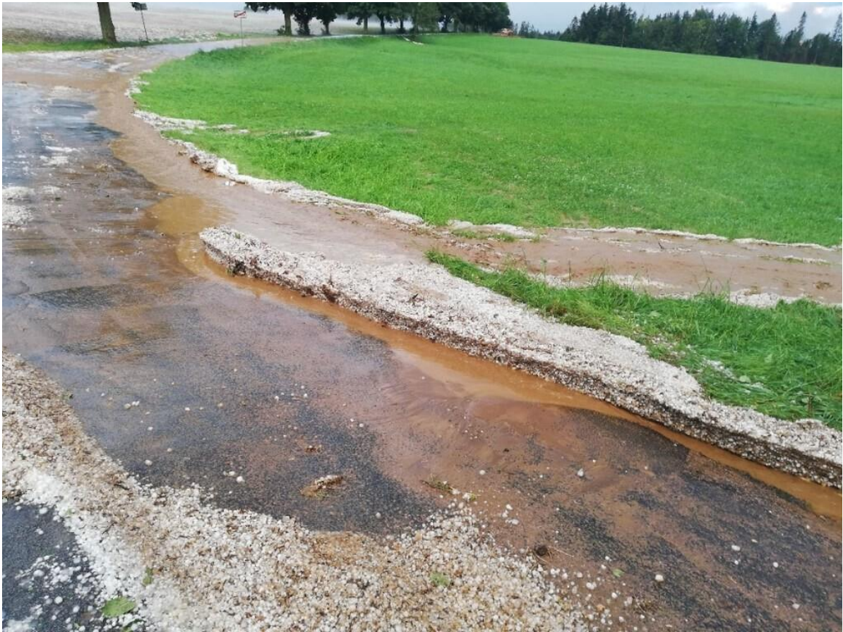
Voda tekoucí z Čachnovského kopce do místní části Pec – kousek od ČOV