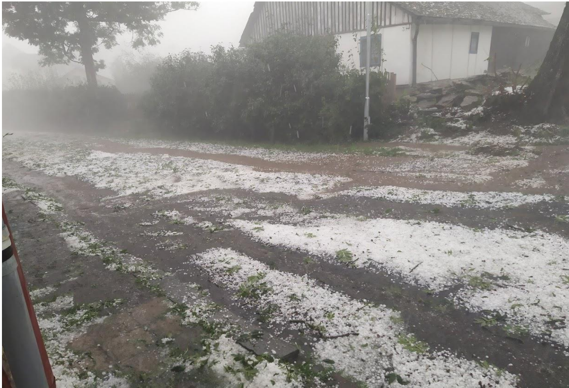
Pohled od domu čp. 2 k domu čp. 3