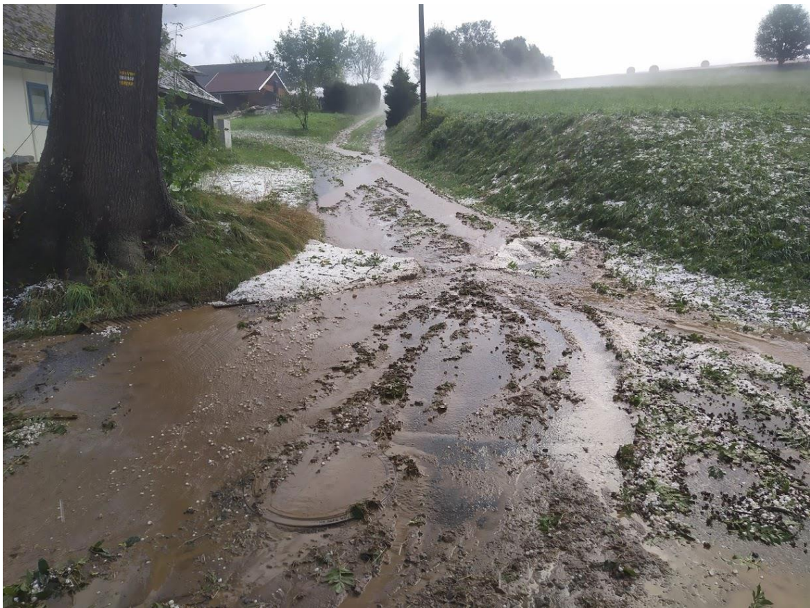
Zpevněná cesta kolem domu čp. 3 a čp. 115 na jižní svah