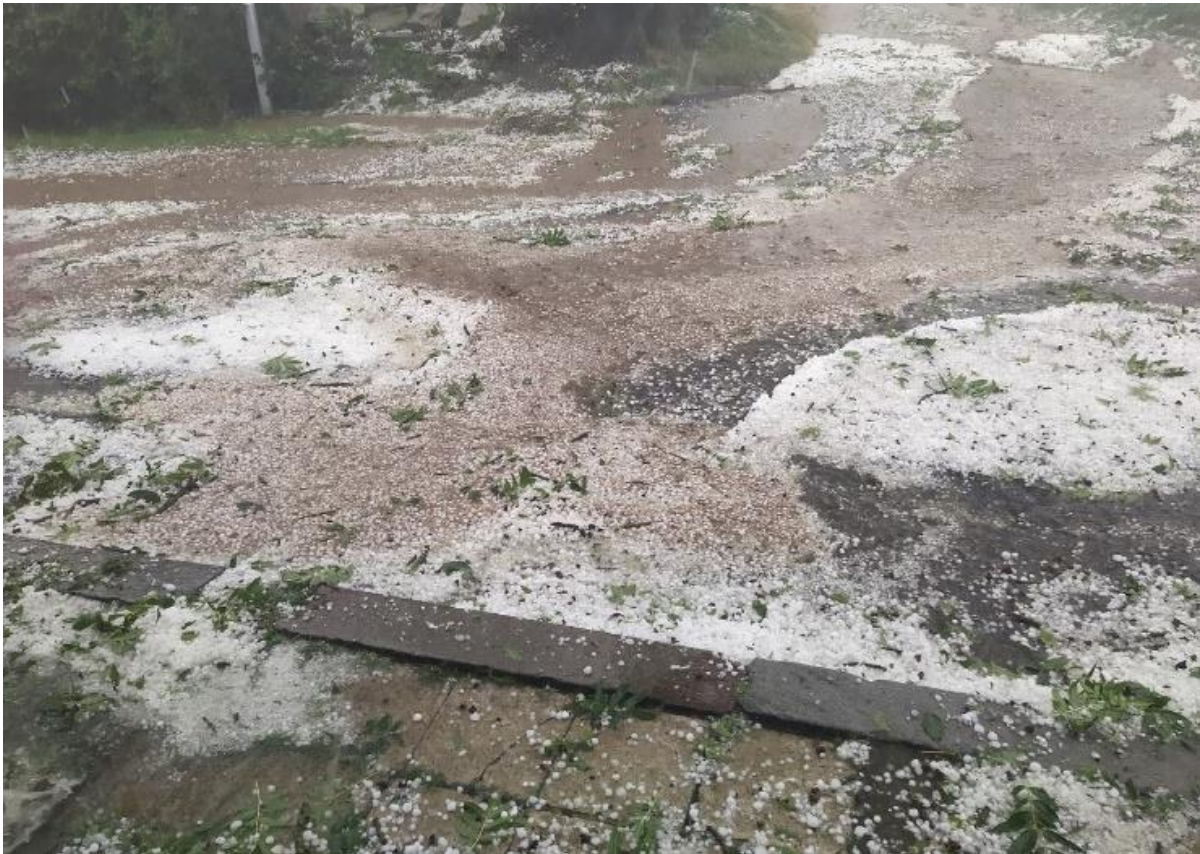
Kroupy před budovou hostince – čp. 2