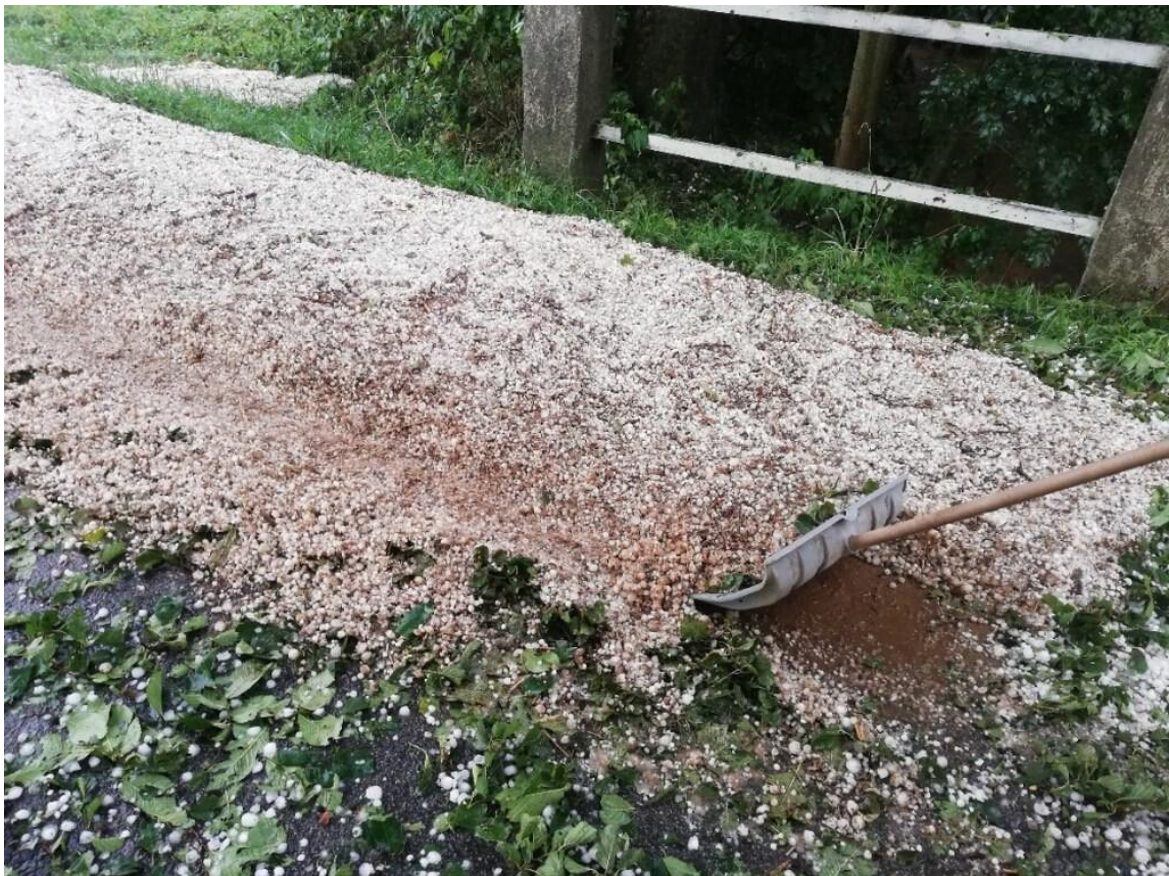
Most přes potok Kamenická voda na sil. č. III/3545 od Čachnovského kopce k místní části Pec