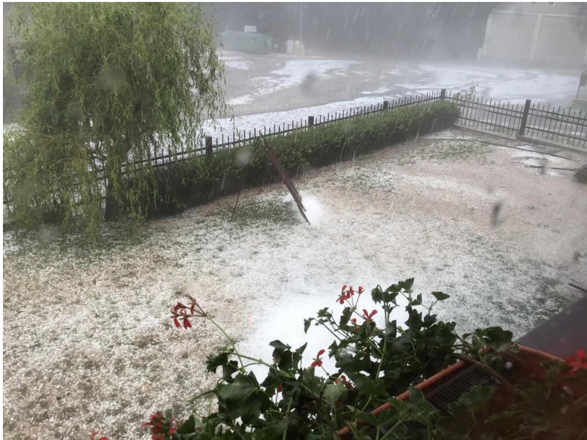
Pohled z domu čp. 163 směrem na silnici III/3548 a k domu čp. 116, který je na fotografii vpravo nahoře