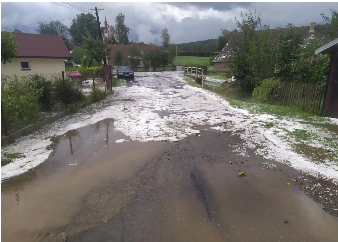
Pohled od hostince směrem ke kostelu po krupobití - II