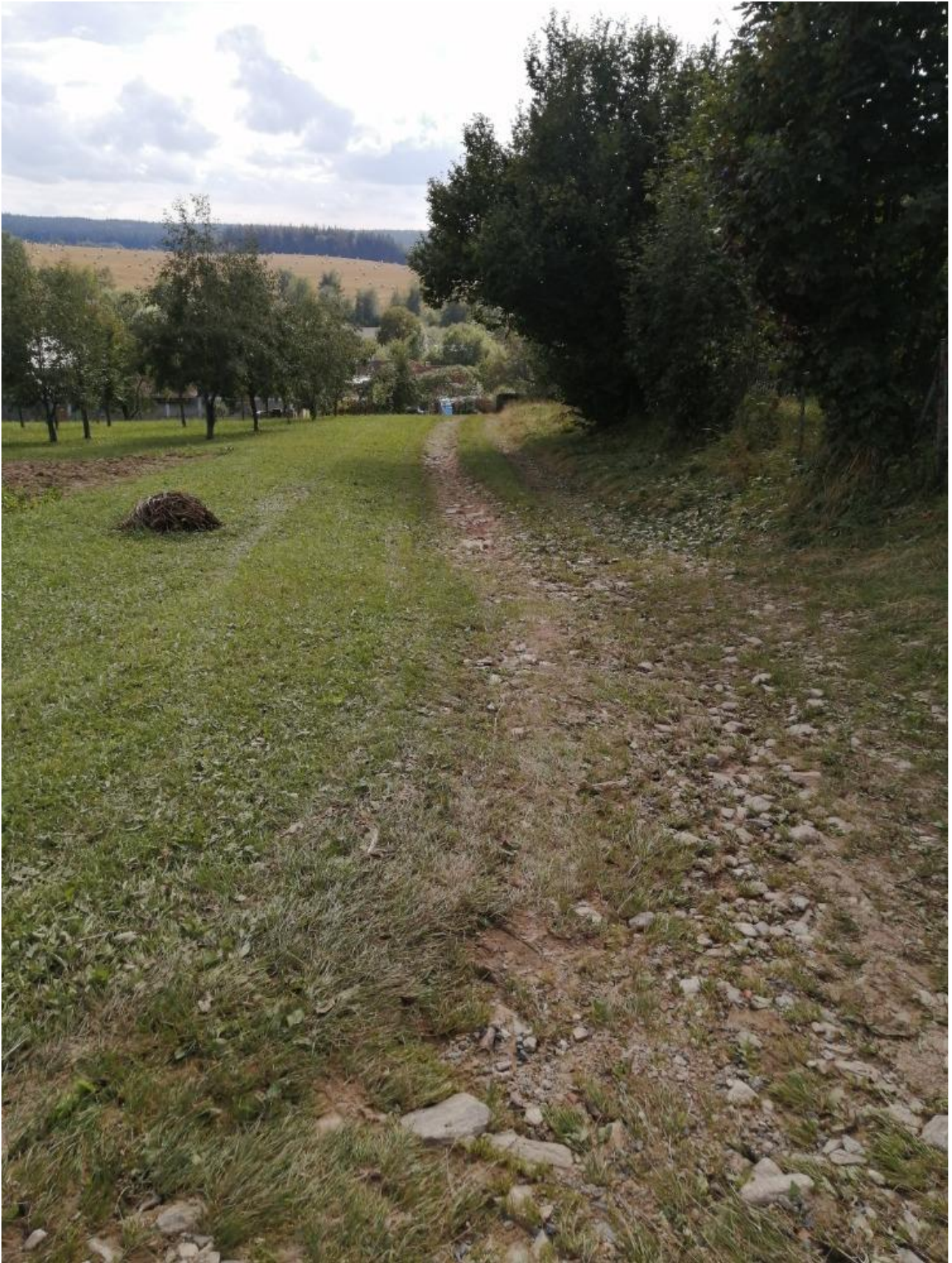
Místo, kudy teče voda k nemovitostem čp. 9 a čp. 142 při přívalových srážkách