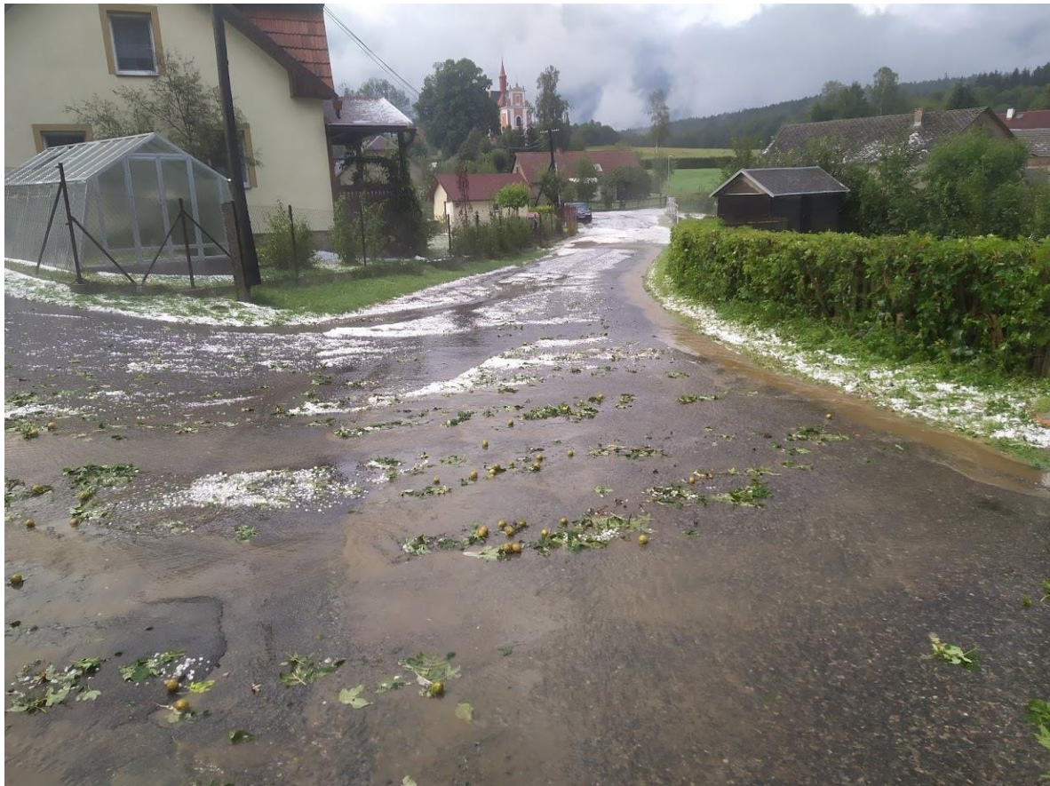
Pohled od hostince směrem ke kostelu po krupobití - I