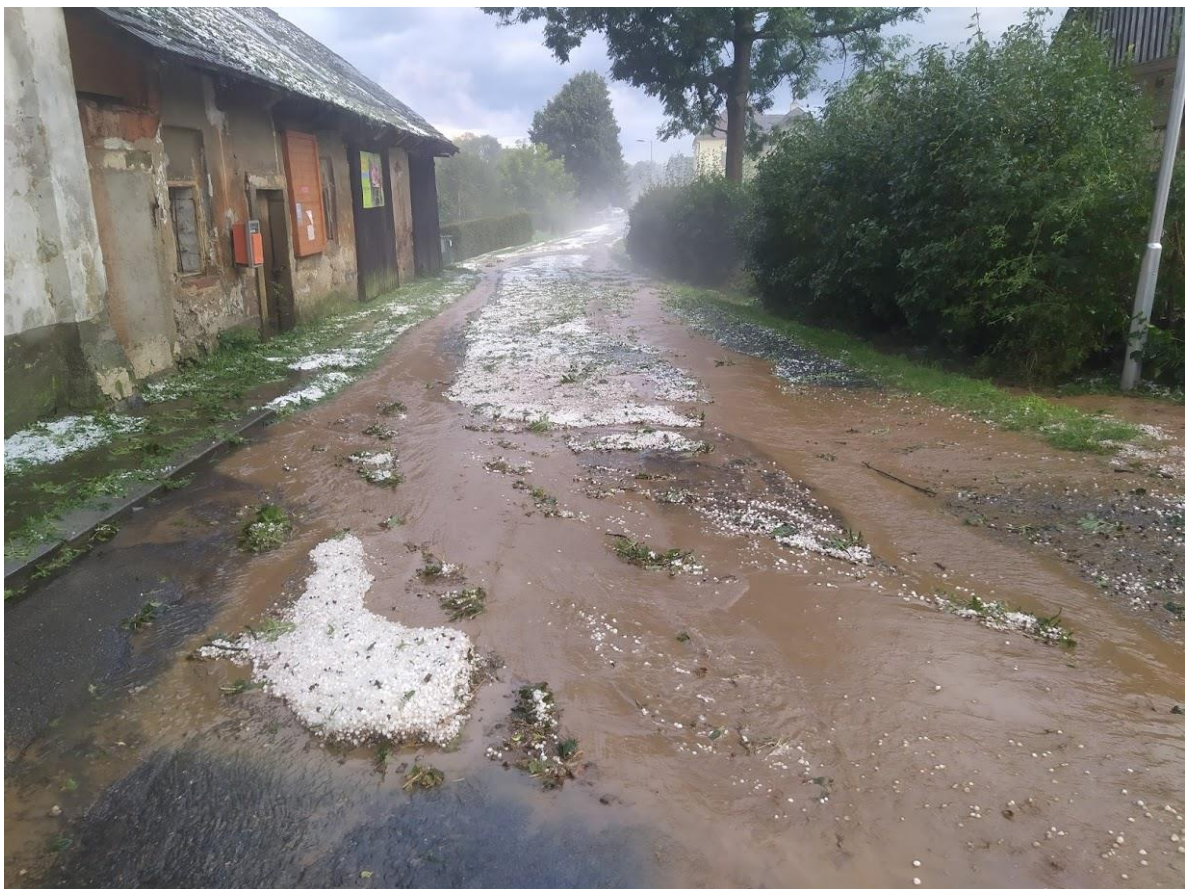
Nános bahna a kamení od čp. 2 po čp. 118 (škola) odklidila ze silnice č. III/3548 dne 7.9.2020 na žádost obce Správa a údržba silnic Pardubického kraje