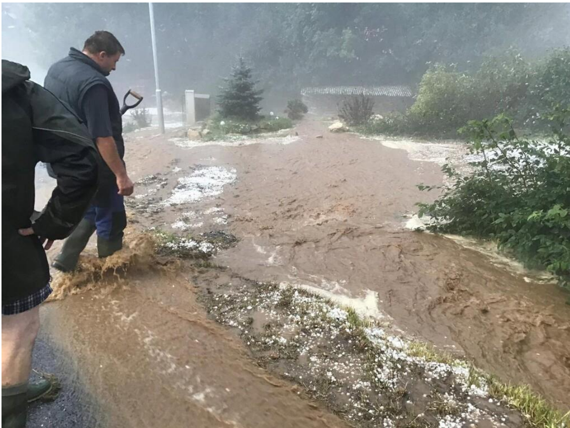
Voda dále tekla kolem domu čp. 163 a dále k domu čp. 84 na silnici, kde se stočila vpravo k domu čp. 116